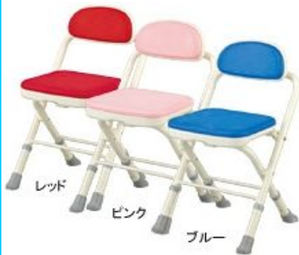
折たたみ シャワーベンチMini