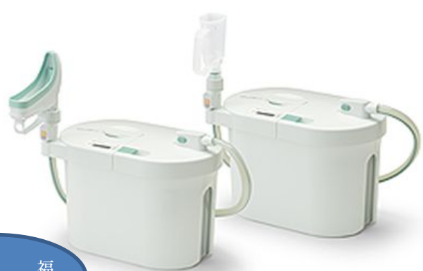
自動採尿器 スカットクリーン