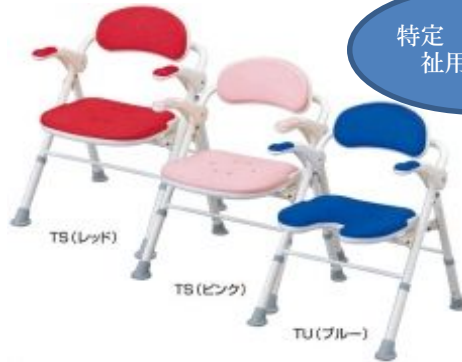
折たたみ シャワーベンチTS