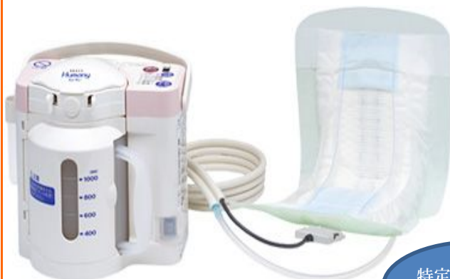
吸引ロボ ヒューマニー