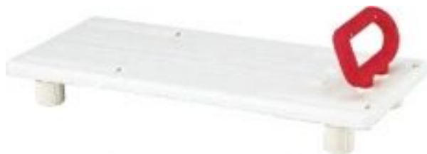
バスボードU-S(幅68cm) バスボードU-L(幅73cm)