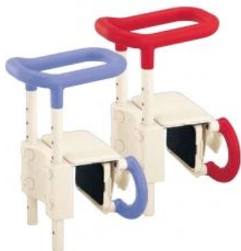
高さ調節付浴槽手すり UST-130