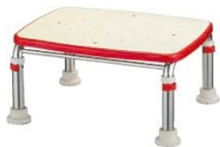
ステンレス製浴槽台R ”あしぴた”シリーズ [標準タイプ]15-20